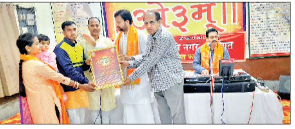
सोनीपत। कार्यक्रम के दौरान अतिथियों को सम्मानित करते हुए।

आर्य समाज ऋषि नगर अलीपुर में वार्षिकोत्सव पर तीन दिवसीय दिव्य सत्संग शुरु