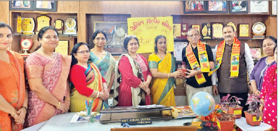
सोनीपत। कार्यक्रम के दौरान अतिथियों का स्वागत करते हुए परिषद के पदाधिकारी एवं सदस्यगण।

अखिल भारतीय साहित्य परिषद सोनीपत इकाई ने नव संवत् पर किया हवन-पूजन