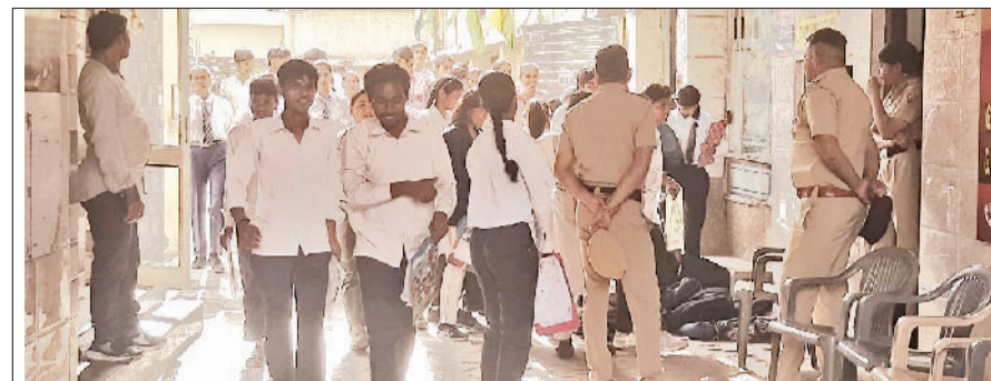
सोनीपत। गीता भवन चौक स्थित बने केंद्र पर परीक्षा देकर बाहर आते विद्यार्थी।

विद्यार्थियों ने कड़े सुरक्षा प्रबंधों के बीच सीसीटीवी की निगरानी में पेपर दिया। परीक्षा को लेकर केंद्र पर प्रवेश व पहलू-पहलू का माहौल रहा। कड़ी जांच के बाद सुबह 11:30 बजे के बाद विद्यार्थियों को परीक्षा केंद्रों में प्रवेश दिया गया। अख्तिक बोर्ड परीक्षाओं में 12 नकल संबंधी मामले उजागर हो चुके हैं, नकल करते पकड़े गए विद्यार्थियों को यूसुफी बनाई गई है।