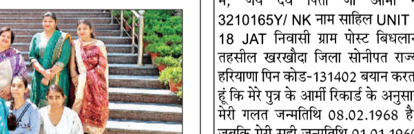
सोनीपत। जीवीएम गर्ल्स कॉलेज में एएम हिंदी की टॉप छात्राओं के साथ प्राचार्या एवं अन्य।

एएम हिंदी की टॉप-20 सूची में जीवीएम की तीन छात्राओं ने दर्ज करवाया नाम