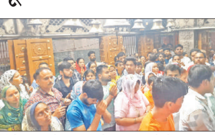
सोनीपत। शचंडी मां महाकाली मंदिर में उमड़ी भीड़।