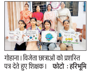
गोहाना। विजेता छात्राओं को प्रशस्ति पत्र देते हुए शिक्षक।