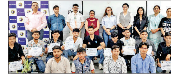
सोनीपत। विजेता प्रतिभागियों के साथ अतिथि एवं स्टाफ।