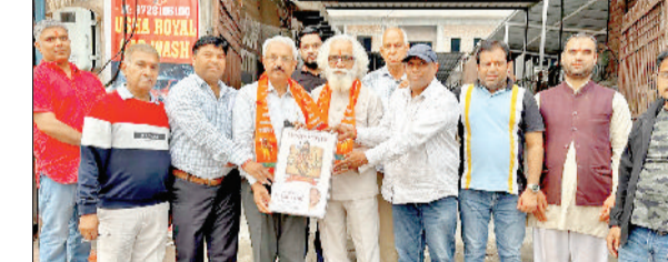
सोनीपत। अतिथियों का स्वागत करते हुए समिति के अध्यक्ष एवं अन्य।

स्मृति चिन्ह भेंट कर सम्मानित किया गया। ब्राह्मण समाज की एकता और संघटन को मजबूत बनाने पर विशेष जोर दिया गया। बताया गया कि समाज को जागरूक कर अधिक से अधिक लोगों को एकजुट करने की दिशा में प्रयास किए जा रहे हैं। कार्यक्रम के अंत में सभी उपस्थित लोगों ने समाज के हित में मिलकर कार्य करने का संकल्प लिया।