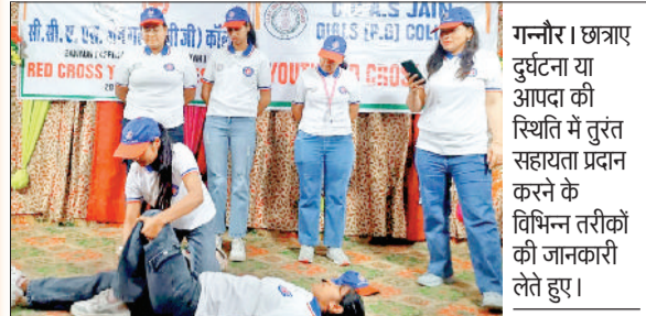
हरिभूमि न्यूज ►► गन्गौर

जैन गर्ल्स कॉलेज गन्गौर में शुक्रवार को रेड क्रॉस की ओर से विशेष प्रशिक्षण सत्र का आयोजन किया गया। प्रशिक्षण सत्र में विशेषज्ञों ने छात्राओं को दुर्घटना या आपदा की स्थिति में तुरंत सहायता प्रदान करने के विभिन्न तरीकों की विस्तृत जानकारी दी। छात्राओं को हृदय गति रुकने की स्थिति में दी जाने वाली जीवन रक्षक प्रक्रिया, रक्तस्राव रोकने के उपाय, घायलों की देखभाल तथा आपातकालीन परिस्थितियों में सही निर्णय लेने के महत्व के बारे में बताया गया। प्रशिक्षण शिविर में कॉलेज की रेड क्रॉस इकाई और राष्ट्रीय सेवा